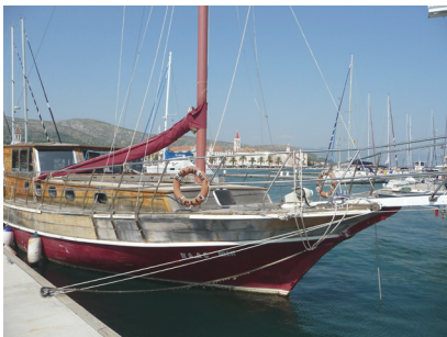
verwendetes Photo: fotolia.com © World Images